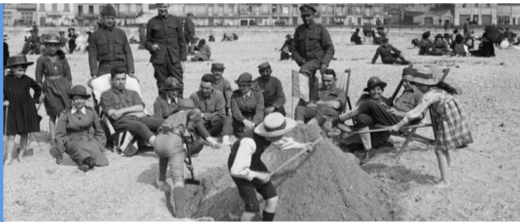
Soldats français et anglais partageant un moment de détente avec leurs familles sur la plage de Boulogne.

Contactez-nous au 03-21-86-90-83 ou contact@musees-montreuil-surmer.fr ou rendez-nous visite à la citadelle.