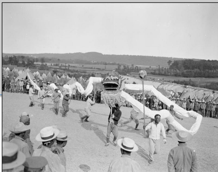
Cérémonie traditionnelle au camp des travailleurs chinois de Samer