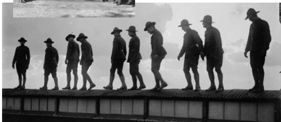
Soldats américains à Camiers