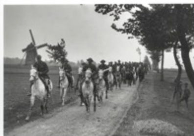
Soldats néo-zélandais sur les hauteurs d'Ecuires