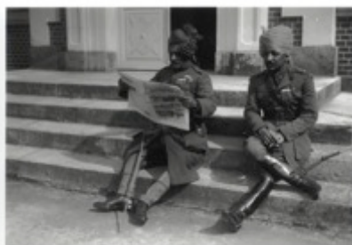
Soldats indiens à Beaumerie-saint-Martin