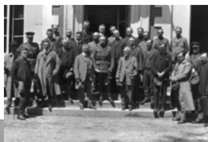
Journalistes canadiens à Montreuil