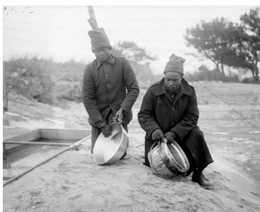
Travailleurs sud-africains à Dannes