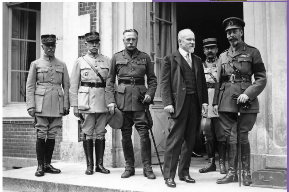
Rencontre au sommet entre le président Raymond Poincaré et le roi George V à Beaumerie-Saint-Martin

Le projet GHQ n'est pas un musée de la Guerre. Il s'intéresse avant tout à ce qui se passe derrière les lignes de front, aux innovations technologiques, à la naissance de la médiatisation, à l'effort logistique, aux avancées de la médecine, aux liens qui se créent entre résidents et militaires tout autant qu'à l'engagement de ces hommes et de ces femmes, à la commémoration et la place du conflit dans notre histoire contemporaine.