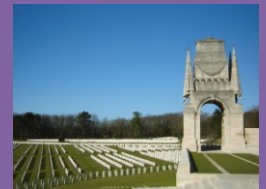
Cimetière britannique d'Etaples-sur-Mer

Celui d'Etaples-sur-Mer, plus de 11000 tombes, est le plus grand cimetière militaire britannique en France. Il témoigne du rôle joué par le Montreuillois durant la Grande Guerre.