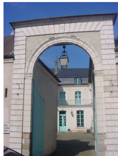
L'hôtel Loysel le Gaucher à Montreuil-sur-Mer

Il a d'ores et déjà reçu le soutien de nombreux partenaires culturels et institutionnels en France et en Europe.