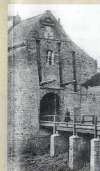
De poort voor 1894