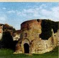
De toren van de koningin Berthe