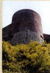
E-toren gerestaureerd van 1996 naar 1999