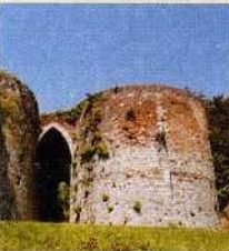
Het kasteel van Philippe Auguste

Deze toren, die was voorzien van een aantal verdedigingsystemen, heeft lang gediend als toegangspoort tot de stad Montreuil-sur-Mer. Men noemde hem "de poort van het kasteel" wegens de nabijheid van het kasteel van Philippe Auguste. Hij werd gebouwd in het midden van de XIVe eeuw. Zijn omvang en de dikte van zijn muren zijn het antwoord van de architecten op de ontwikkeling van de aanvalsmiddelen en in het bijzonder op de komst van het kanon. Ten tijde van de bouw van de citadel gaf deze poort direct toegang tot het binnenplein. Omdat dit gevaarlijk werd geacht, is de poort in 1599 dichtgemetseld. De toren bewaart de herinnering aan Berthe van Holland, echtgenote van Franse koning Philippe I,